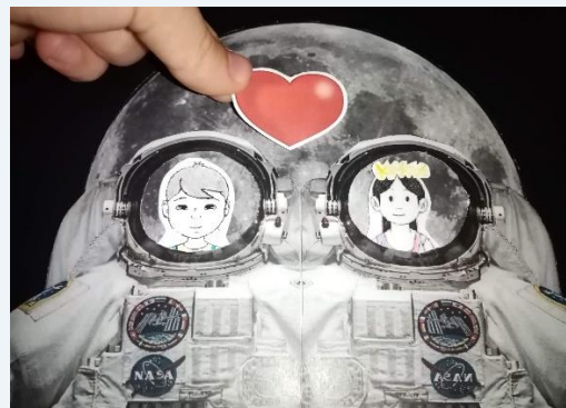
Collages: Roxana Bobric, CNCH Piatra- Neamt